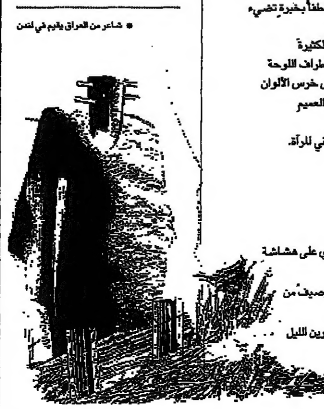
خمس من العراق يقيم في لندن

لقد اخذ العهد الجديد على عهده تنمية الصحافة معتبراها اداة الاعلامية الثانية (بعد التلفزيون) وكرس لها العديد من الامتيازات المالية والمعنوية، ولم يخف رئيس الجمهورية في العديد من المناسبات رغبته في ان تكون الصحافة التونسية اكثر فاعلية في الحياة اليومية واكثر جورة في تناولها لوضعيها، الا ان الملاحظ يستنتج تراجعا في هذه الصحافة.